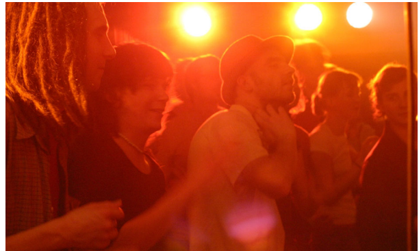
Fans des Jazz-Festivals der Uni Dortmund