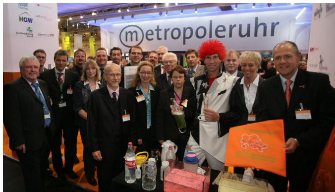
Das Team der Metropole Ruhr in der Messehalle der Expo Real im München.

„Hier können Sie anlegen“ war das Motto, unter dem das Ruhrgebiet seine neuen Immobilienprojekte am Wasser vorstellte. Mit Titeln wie „Urbane Wasserlagen“ oder „Fluss, Stadt, Land“ präsentierten sich rund 30 Einzelprojekte mit großer Nutzungsvielfalt für Wohnen, Dienstleistung und Gewerbe auf einer Fläche von mehr als 1.000 Hektar und mit einem Gesamtinvestitionsvolumen von rund drei Milliarden Euro. Geschätzte 28.000 zusätzlicher Arbeitsplätze könnten so am Wasser entstehen. Wasser ist auch Thema der „Entdeckungsreise durch die Wissensmetropole Ruhr“. Im September wird der Regionalverband Ruhr gemeinsam mit den Städten Dortmund, Bochum, Duisburg und Essen eine dreiwöchige Veranstaltung zum Thema Wasser durchführen. Ziel ist es, die Wissenschaft, Wirtschaft und die Öffentlichkeit durch kulturelle und wissenschaftliche Aktionen näher zusammen zu bringen.